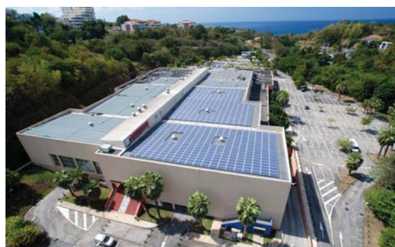
Martinique – Schoelcher, tertiaire – 164 kWc