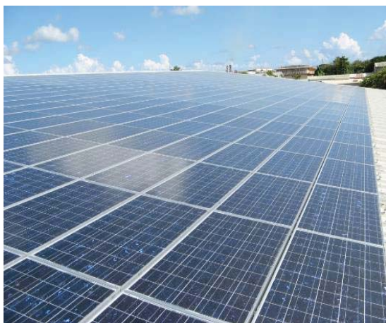
Guadeloupe – Jarry, tertiaire - 80 kWc