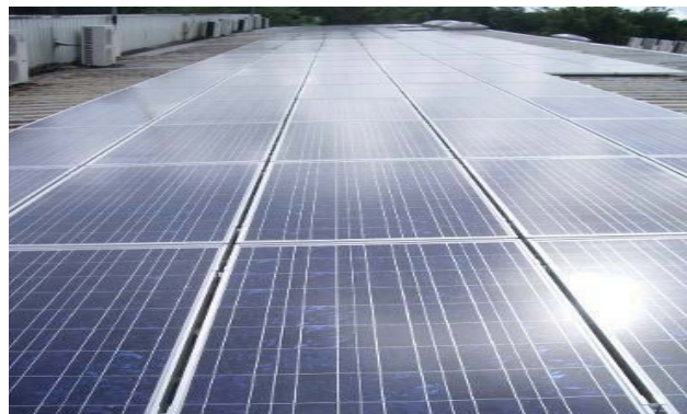
Martinique – Lamentin, tertiaire – 36 kWc