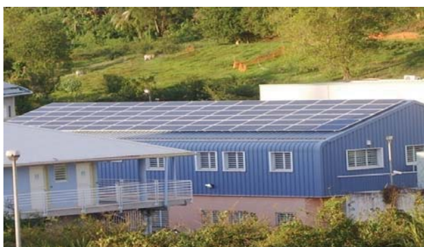
Martinique – Fort de France, tertiaire – 36 kWc