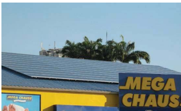
Guadeloupe – Les Abymes, tertiaire – 35 kWc