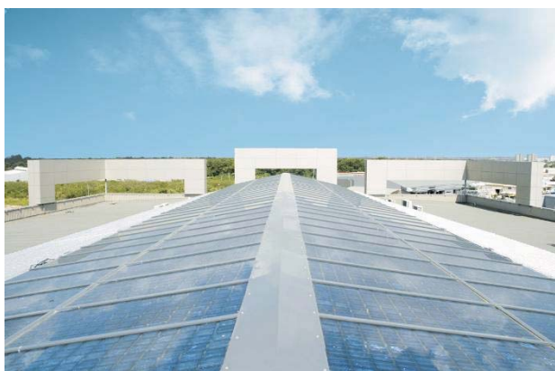
Guadeloupe – Baie Mahault ,centre commercial Verrière photovoltaïque de 24 kWc