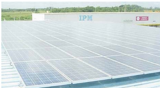
Guyane – Cayenne, industriel– 36 kWc