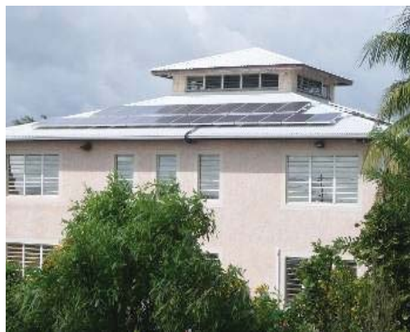
Martinique – Lamentin, tertiaire - 10 kWc