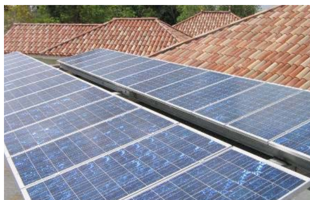
Guadeloupe – Gosier, tertiaire – 5kWc secourus