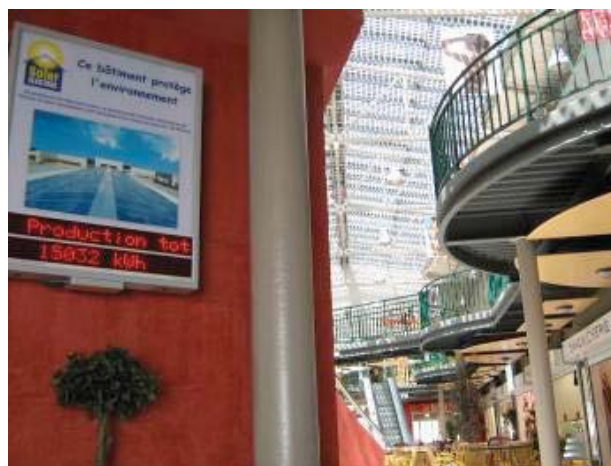
Guadeloupe – Baie Mahault ,centre commercial Verrière photovoltaïque de 24 kWc vue intérieure avec écran d'information du public